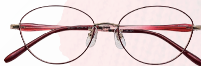
EYE GARDEN 2077

当店でご購入の遠近両用レンズに馴染めなかった場合、お渡し後3ヶ月以内に限り、レンズを無料でお取り換えできるので初めての方でも安心です!