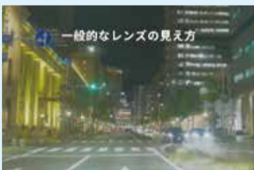
一般的なレンズの見え方

コントラストを上げる効果もあり、雨の日や曇りの日、 夜のお散歩やドライブ時も視界良好です。